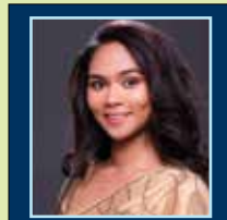
Concept by: S.SHRUTHI LAKSHMI B.Sc., (psychology)

As sunlight is the finest source of vitamin D, get as much sun as you can. Although it could be tempting, warming up and toasting yourself might wake you up.