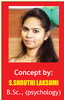
Concept by: S.SHRUTHI LAKSHMI B.Sc., (psychology)

Mother, sisters, wives, girlfriends, and fiancées... what would we ever do without them? Nobody can honestly say we don't owe an enormous amount to the women in our lives, from the mothers who made us chicken soup when we were sick as children, to the sisters who helped us decide what to wear on our first date, to the wives who somehow manage to juggle both a career and a family, never missing a beat. Women's Day is all about celebrating these incredible people and showing them how much we love, respect and value them.