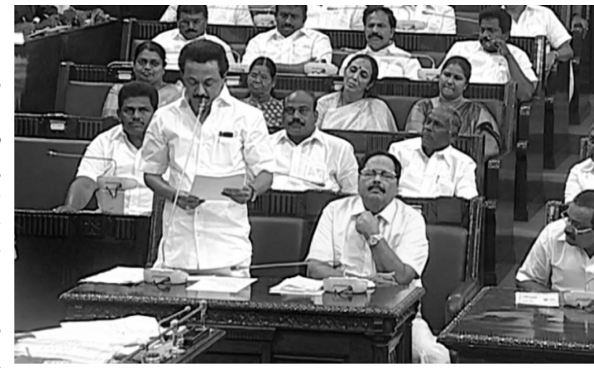
சட்டசபையில் கவர்னர் உரைக்கு நன்றி தெரிவிக்கும் தீர்மானத்தின் மீது பேசும் எதிர்கட்சித் தலைவர் மு.க.ஸ்டாலின்

பொதுவாக அ.தி.மு.க.வில் ஏதேனும் புகார் அளிக்கப்பட்டால் சம்மந்தப்பட்ட நபர் மீது பாரபட்சமற்ற முறையில் உடனடியாக நடவடிக்கை எடுக்கப்படுகிறது. ஆனால் தி.மு.க.வில் அந்த மாதிரி நடவடிக்கைகள் எதுவும் எடுக்கப்படுவதில்லை. அ.தி.மு.க. ஆட்சியில் பொது மக்கள் காவல்துறையினரிடம் ஏதேனும் புகார் தந்தால் உடனடியாக நடவடிக்கை எடுக்கப்படுகிறது. அ.தி.மு.க. வினரின் தலையீடோ, குறுக்கீடோ இருக்க