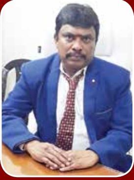
முத்தாண்டின் புதிய பாதை - ஆசிரியர் கடிதம்