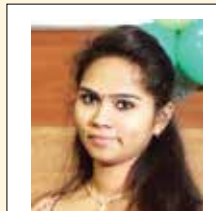
Concept by: S.SHRUTHI LAKSHMI B.Sc., (psychology)

There are many bad habits people want to give up when they start fresh. Maybe you've been wanting to break the same bad habit for many years. Make this year the year you finally do it. While phones can be helpful, they can also be really distracting as well. Learn to spend less time on your phone and more time with people in person.