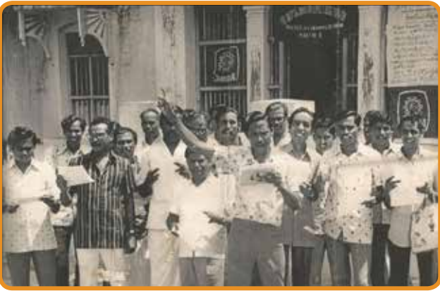
கட்டுரையாளர் 41 ஆண்டுகளுக்கு முன்பு சேலம் வங்கி முன்பு ஆர்ப்பாட்டம் நடத்திய காட்சி.

கொண்டு ஒவ்வொருவரும் வங்கிப் பணம் கிடைத்தவுடன் முதலில் யார் யாருக்கு எவ்வளவு கொடுத்தார்கள் என்ற ஒரு ஒரு ஜாபிதா தயாரிக்கலாம்!