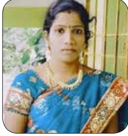
S. கவிதா சிட்லபாக்கம்

செய்முறை : முதலில் ஒரு கிண்ணத்தில் துருவிய பனீர் 1 கப், துருவிய சீஸ் 1 கப், சிறிது சிறிதாக வெட்டிய குடைமிளகாய், 3 ஸ்பூன் சில்லிபவுடர், இஞ்சி புண்டு விழுது, சீரகத்தூள் அரை ஸ்பூன், மிளகு தூள் அரை ஸ்பூன், நறுக்கிய கொத்தமல்லி, சிறிதளவு , Tomato ketchup 5 spoon, தேவையான அளவு உப்பு சேர்த்து ஒன்றாக கலந்து வைத்துக் கொள்ளுங்கள். அடுத்து பிரட் சிலேஸ்களின் நான்கு ஓரங்களை கட் செய்யவும். பிறகு பிரட் சிலேஸ்களை சப்பாத்தியைப் போல உருட்டிக்